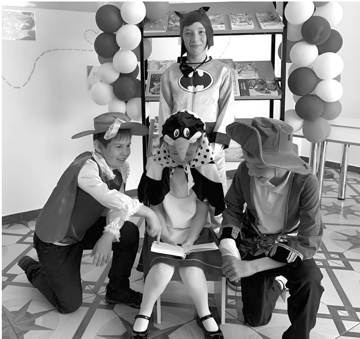
В СОШ аула Псаучье-Дахе в гости к ребятам пришли герои детских книг

На закрытом плоскогорье Он не видел злых туманов, И предательских обманов Он не знал, не ведал горя. Твёрдым бил своим копытом, Пил травы зелёной соки, Был весёлый и высокий, Был усталый, часто сытый. Именем была свобода. Та, в горах что громко пела И с крутого небосвода Возвратиться не успела. В день, когда речной прохладой Ноги сломанные мылись — То глаза его закрылись, Дав за вольницу расплату.