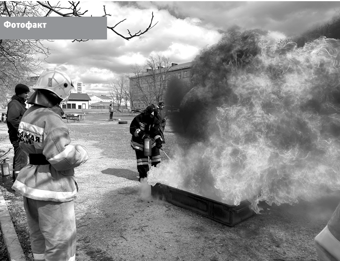
Фотофакт С 18 марта по 5 апреля в республике проходил региональный этап чемпионата профессионального мастерства «Профессионалы»-2024. На базе Технологического колледжа в Черкесске студенты и старше школьники демонстрировали свои знания по дисциплине «пожарная безопасность». На данном этапе участники должны были без загвоздок пройти такие дисциплины, как боевое развертывание и надевание одежды пожарного, а также тушение условного возгорания. Помощь в организации соревнований оказывали сотрудники ГУ МЧС РФ по КЧР.